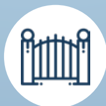
ONE GATE SYSTEM