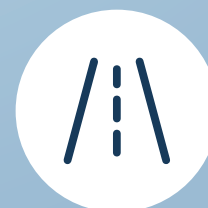
6-7 METERS LANE ROADS