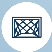
OUTDOOR FUTSAL COURT